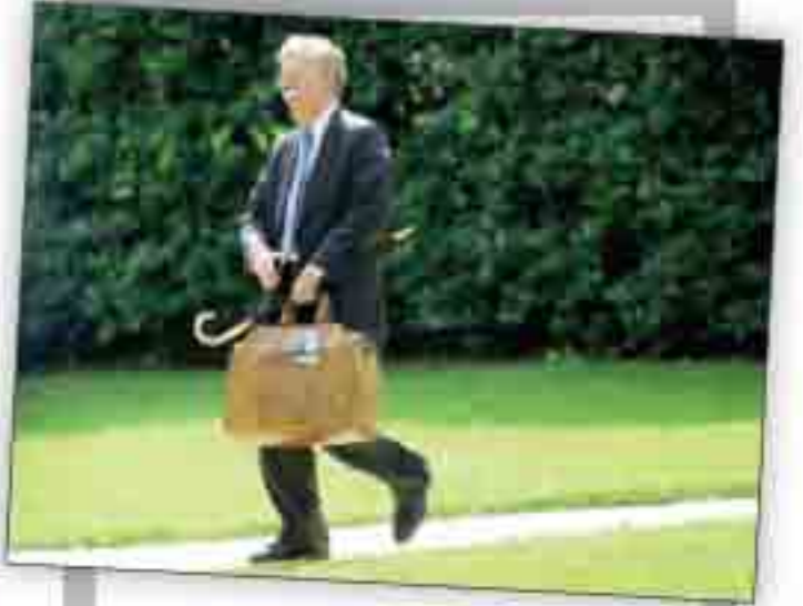
شترنج بدون بولتون