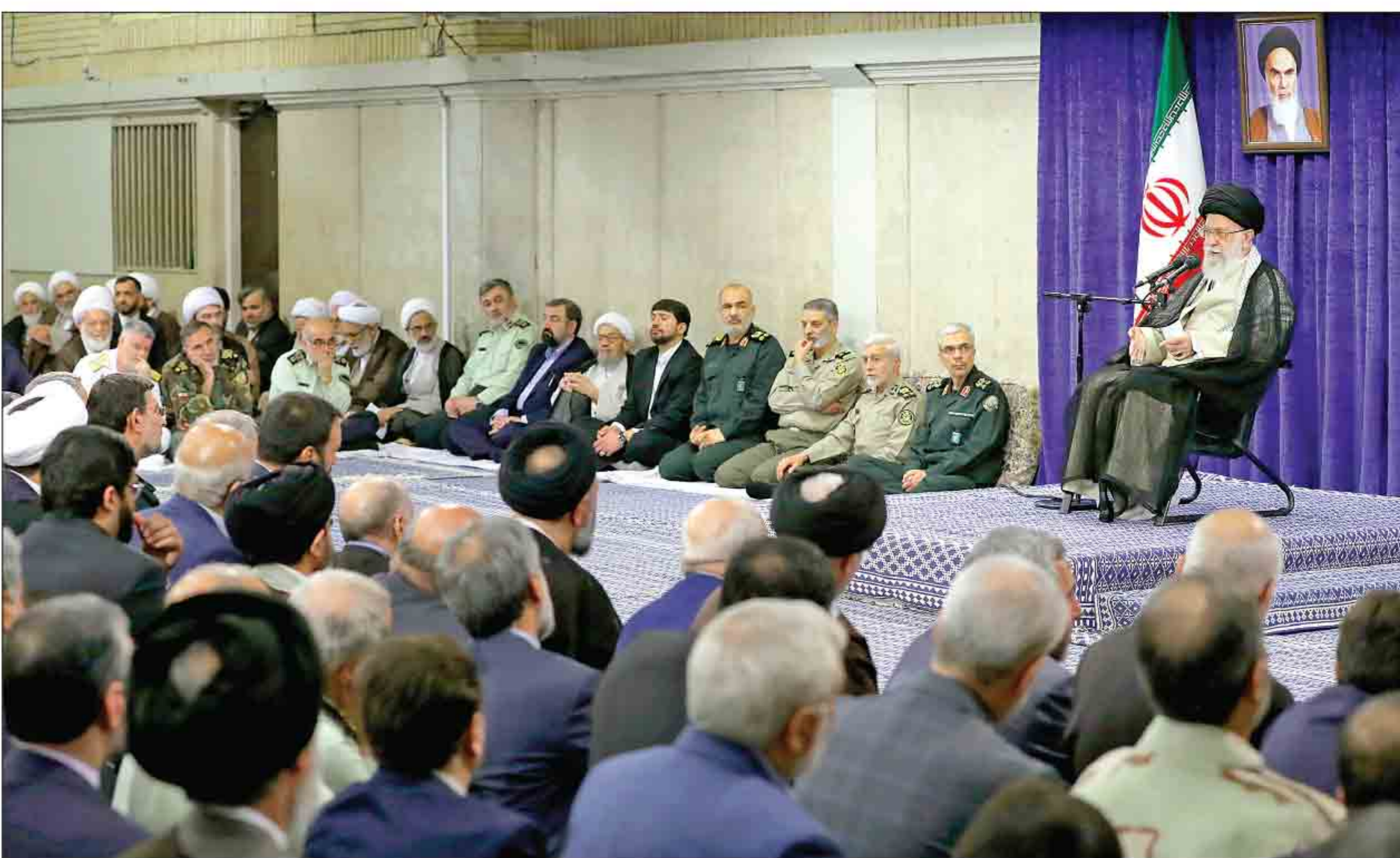
عبدالله خامنه ای

این برخورد، برخورد اراده هاست و اراده ما قوی تر است، چون علاوه بر اراده خود، توکل به خدا را هم داریم