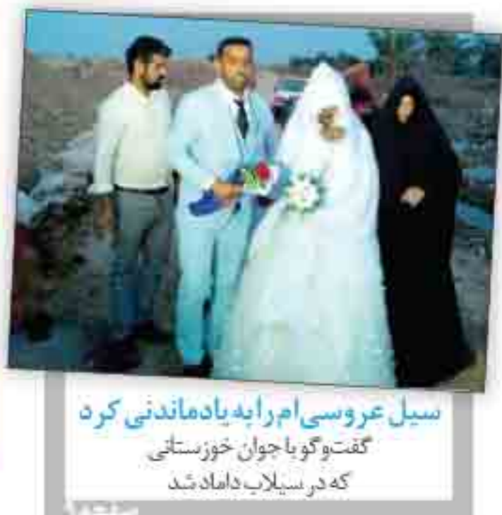
سپیل عروسی امرا به یادماندنی کرد گفتوگو با جوان خوزستانی که در سیلاب شاد شد