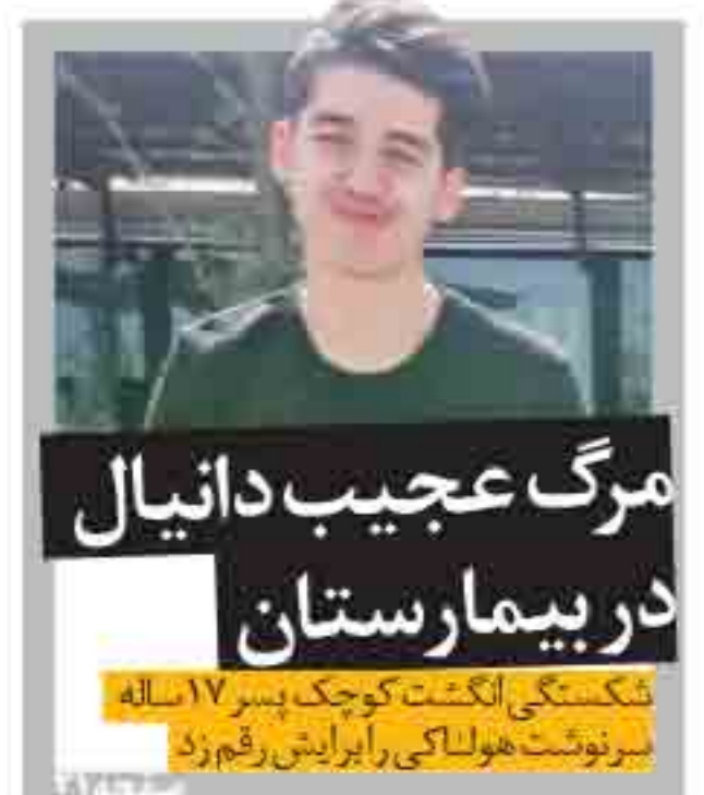
مرگ عجیب دانیال در بیمارستان