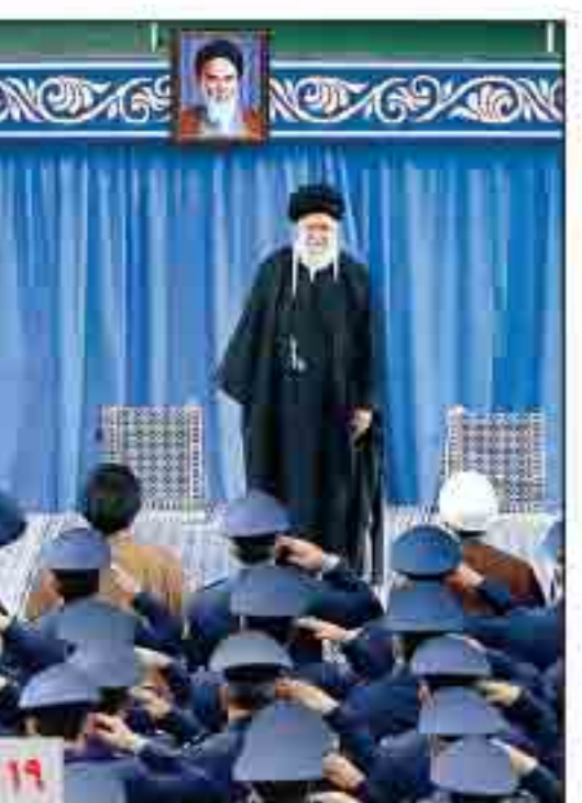
رهبر معظم انقلاب در دیدار فرماندهان و کارکنان نیروی هوایی

هیچ مسئله‌ای مردم را از نظام رویگردان نمی‌کند