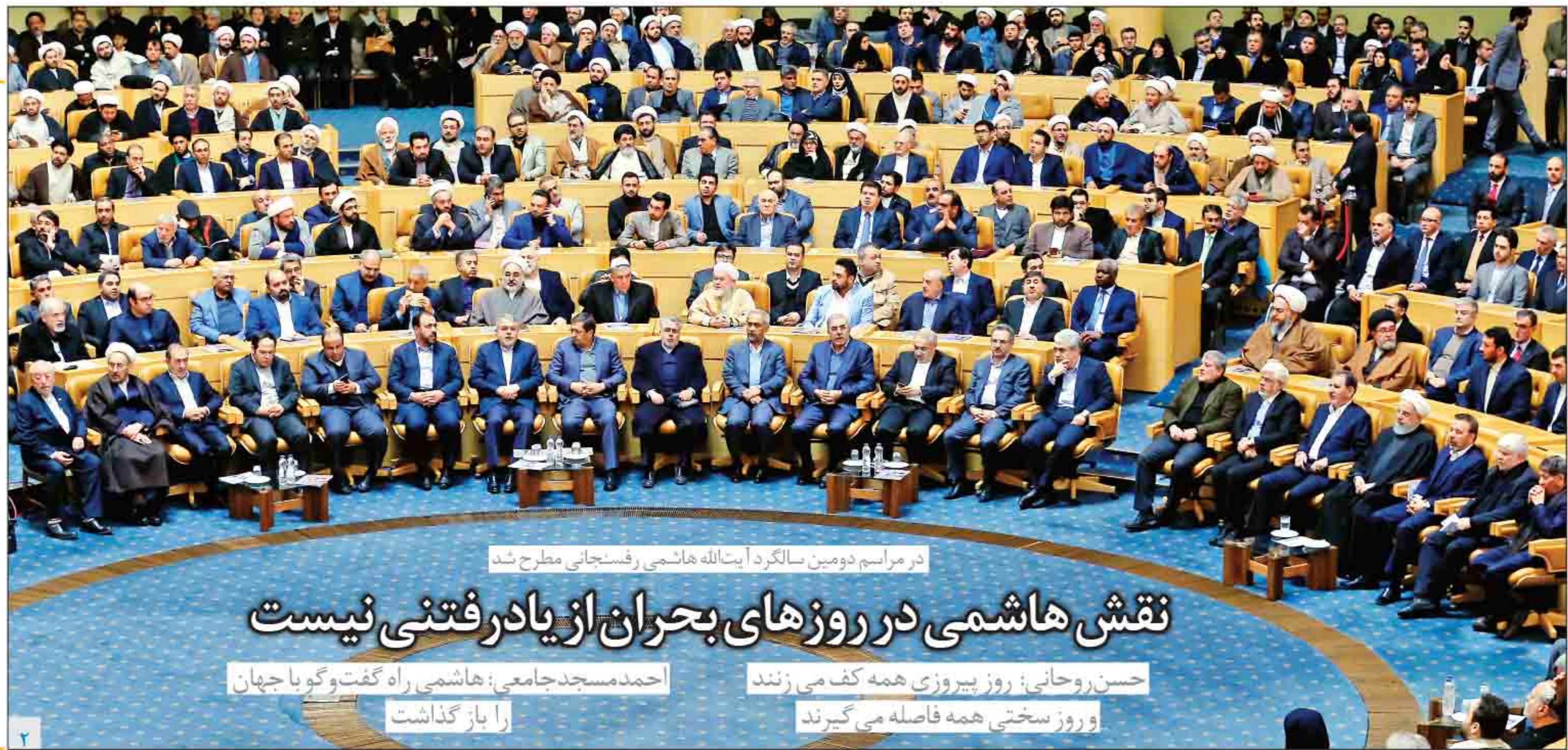
در مراسم دومین سالگرد آیت الله هاشمی رفسنجانی مطرح شد

با گفتارهایی از محسن هاشمی، محسن پورسیدآقای، مهرداد تقی زاده، محمود میرلوحی و اظهار نظر برخی از اعضای شورای شهر در فضای مجازی