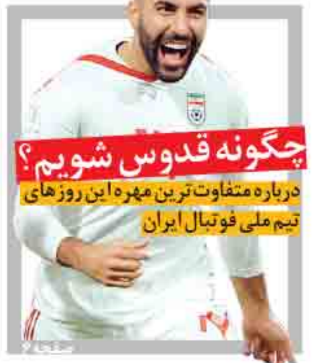
چگونه قدوسی شویم؟ درباره متفاوتترین مهره این روزهای تیم ملی فوتبال ایران