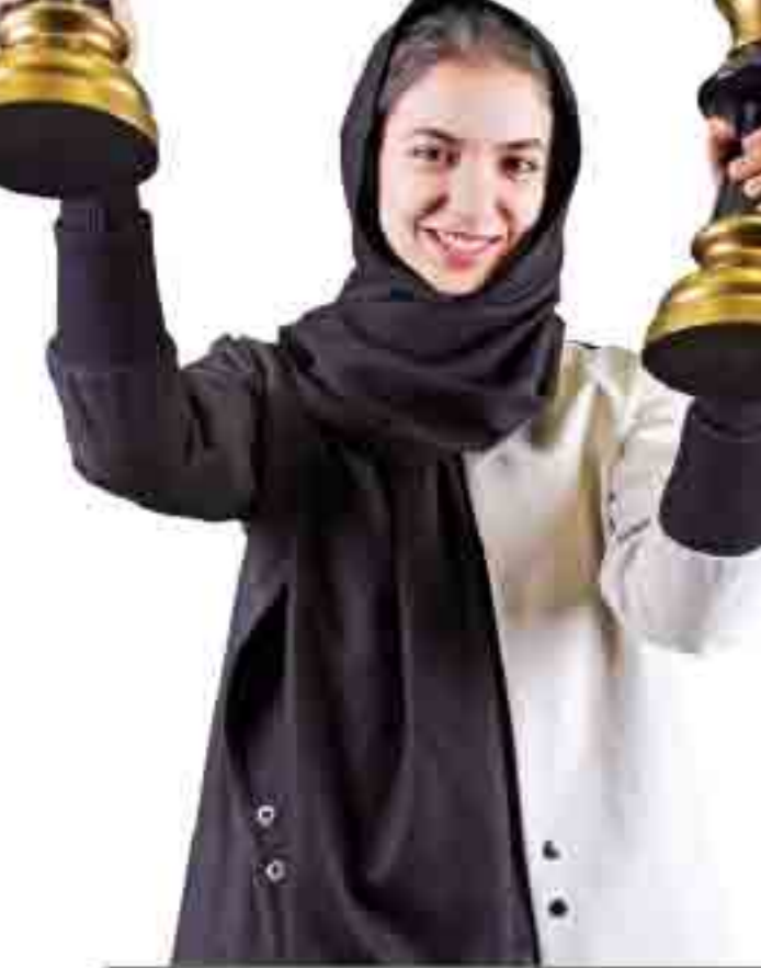
گفت‌وگو با سارا خادم‌الشریعه، قهرمان مسابقات سریع شطرنج جهان و بانوی اول ورزش ایران

مدام به من می‌گوید تو مدال طلا می‌گیری و دغدغه‌اش پیشرفت من در شطرنج است