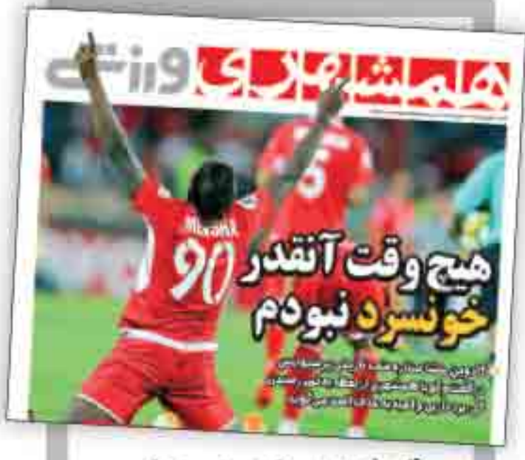
۴ صفحه همشهری ورزشی

شبهه ۳۱ شهریور ۱۳۹۷ | ۱۲ مهر ۱۴۰۰ | سال بیست و هشتم | شماره ۲۸۸۴ | هفته ۲۸ | استان ۱۲ | صفحه راهنمای کشور ۴ | صفحه استان ها ۵۰۰ | تهران ۸۴ | صفحه راهنما ۴ | صفحه مجله و الیزا ۱۰۰ | تومان