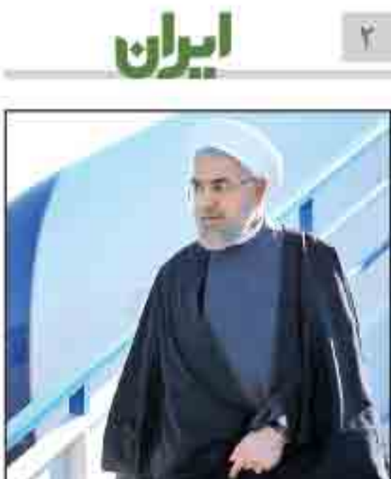
رئیس جمهور فردا به نیویورک می رود