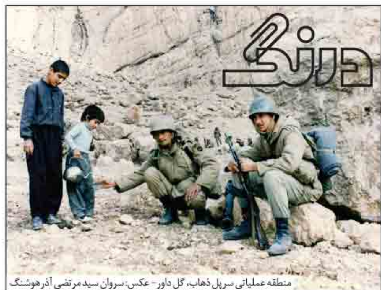
مقطعه عملیاتی سرپل ذهاب، گل داور

تصویر، موسیقی و روایت هایی درباره جنگ تحمیلی