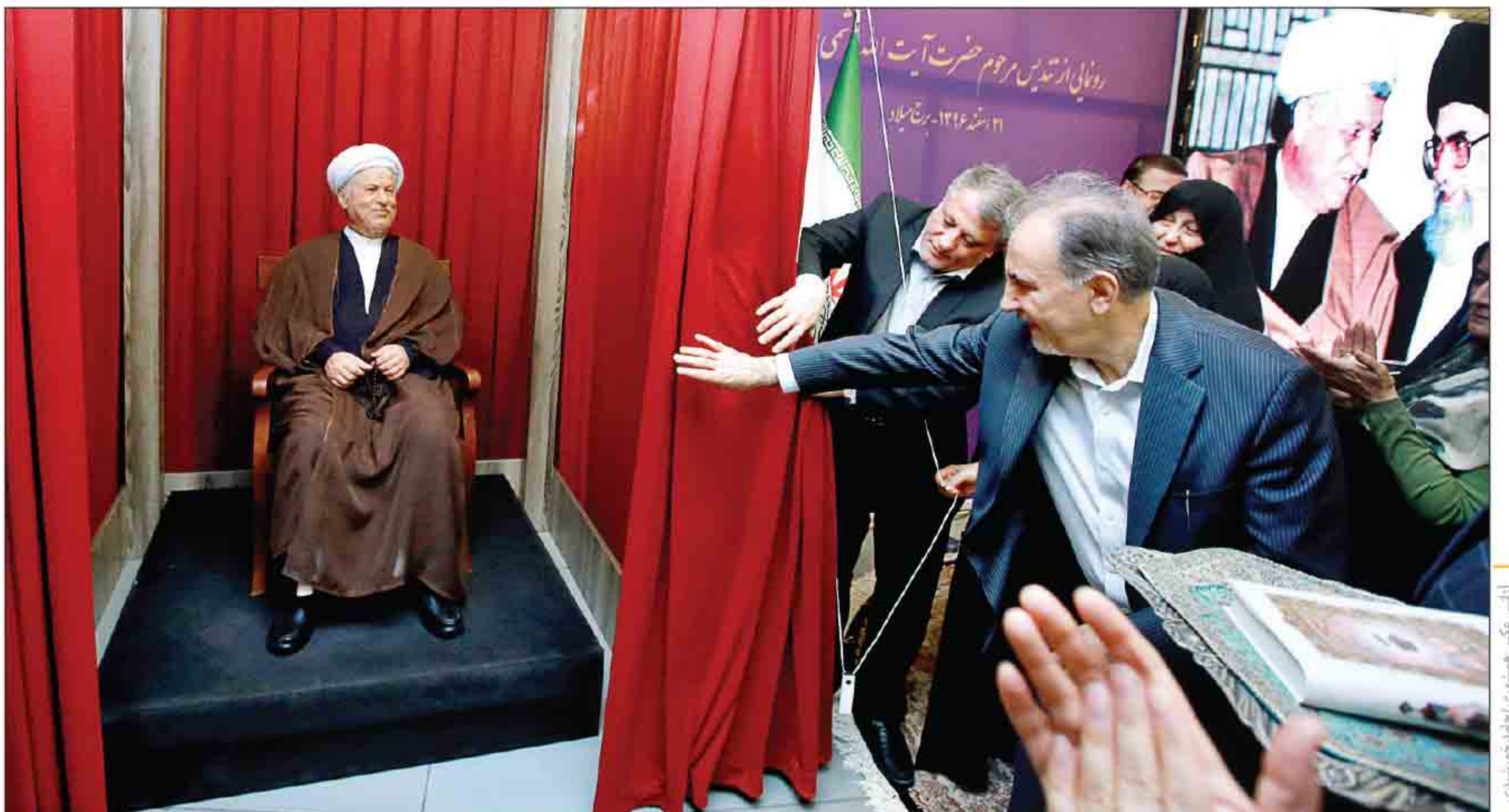
با حضور همسر مرحوم هاشمی، شهردار و اعضای شورای شهر تهران صورت گرفت

معاون وزیر آموزش و پرورش از جزئیات حذف مدارس تیزهوشان به همشهری می‌گوید