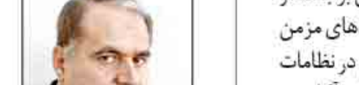
سیدحسین موسویان، استاد دانشگاه پریستون

چند هفته پیش در یکی از مراکز مطالعاتی آمریکایی مناظره‌ای بین من و یکی از مقامات عالی‌رتبه پیشین عربستان در حضور حدود دهه‌ها تن از نخبگان آمریکا انجام شد. در این نشست من سیاست‌ها و اقدامات مذاخله‌گرایانه عربستان (از جمله در قطر، سوریه، عراق، بحرین و لبنان)، تأثیرات مخرب جنگ‌های آمریکا و عربستان در منطقه (از جمله حمله نظامی به عراق و افغانستان و یمن و لیبی)، سرمایه‌گذاری‌های عربستان در صدور ایدئولوژی وهابیت و نقش این تفکر در خلق گروه‌های تروریستی (همچون داعش و القاعده) را برشمردم و آنها را عوامل اصلی بی‌ثباتی و گسترش تروریسم و افراط‌گرایی در منطقه خواندم. ضمناً تلاش‌های ایران برای مبارزه با تروریسم را متذکر شده و تئوری جمهوری اسلامی برای صلح و امنیت از طریق ایجاد یک سیستم همکاری و امنیت جمعی در خلیج فارس را تشریح کردم. مقام پیشین سعودی در پاسخ به اظهارات من یک پرونده‌ای را باز کرد و گفت: من به مطالب دکتر موسویان احترام می‌گذارم اما چند نکته از گفته‌های مقامات رسمی ایران برای شما نقل کنم: «انقلاب اسلامی ایران محدود به مرزهای ایران نمی‌شود»، «مرزهای امنیتی ایران تا دریای مدیترانه گسترش پیدا کرده»، «ایران امروز امپراتوری گذشته را تجدید کرده و پایتخت آن بغداد است»، «انقلاب یمن محدود به این کشور نخواهد شد و مرزهای عربستان را فراگرفته و تا عجم این کشور گسترش خواهد یافت» و... مقام پیشین سعودی بعد از قرائت لیست مفصلی از این نوع اظهارات خطاب به جمعیت گفت که اینها گفته‌ها یا ادعاهای عربستان نیست.