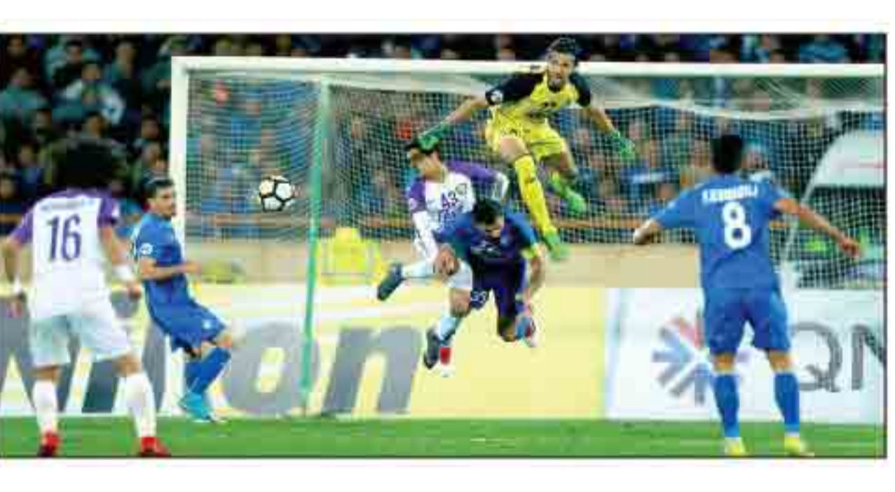
استقلال در حضور بیش از ۸۰ هزار تماشاگر حاضر در ورزشگاه آزادی توانست مقابل العین به برتری برسد و به تساوی یک بر یک مقابل این تیم اماراتی رضایت داد.